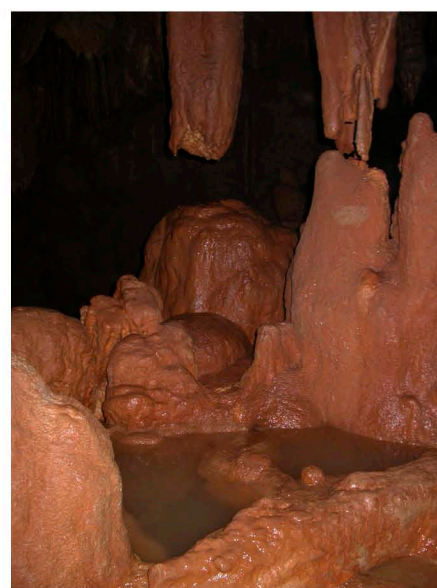
A sinistra il grande gour detto “Vasca di Poppea” (punto 1) e, a destra, altri gour nello stesso Salone con acque di stillicidio