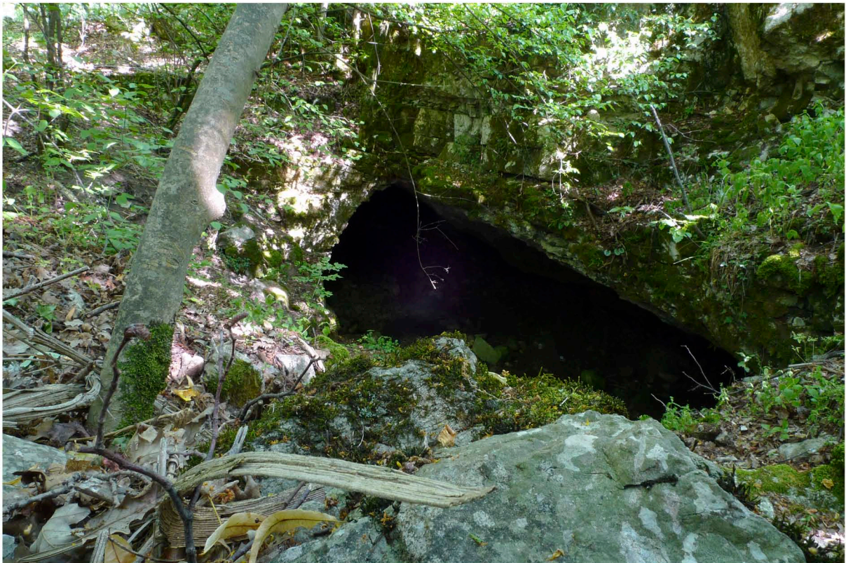
Il caratteristico ingresso della caverna