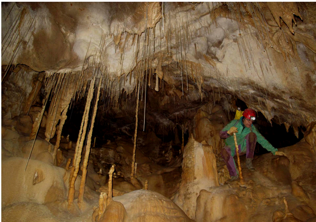
Concrezioni nella Grotta Martina (punto 1)