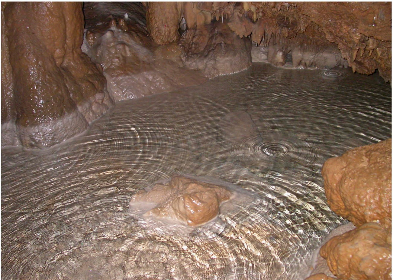
Habitat: Laghetto stillicidio alla base P45