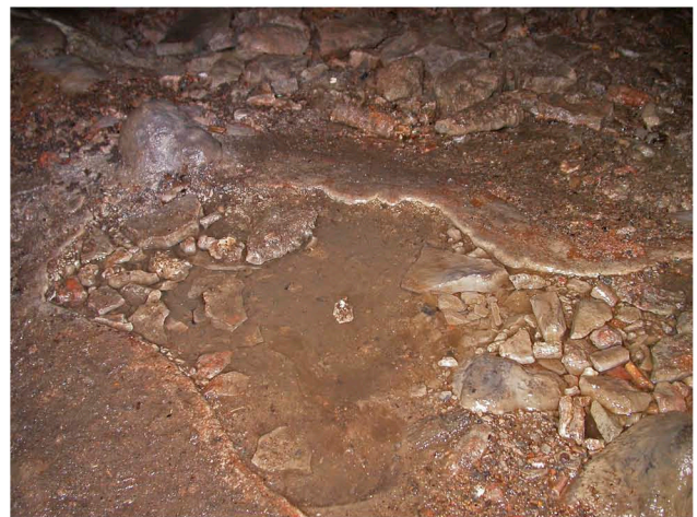
A sinistra: Nella galleria artificiale di accesso