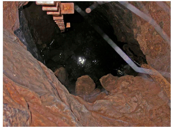
A sinistra: l'imbocco della cavità, sede dell'associazione parietale (punto A) A destra: il pozzo terminale che raggiunge le acque carsiche di base (punto 1)