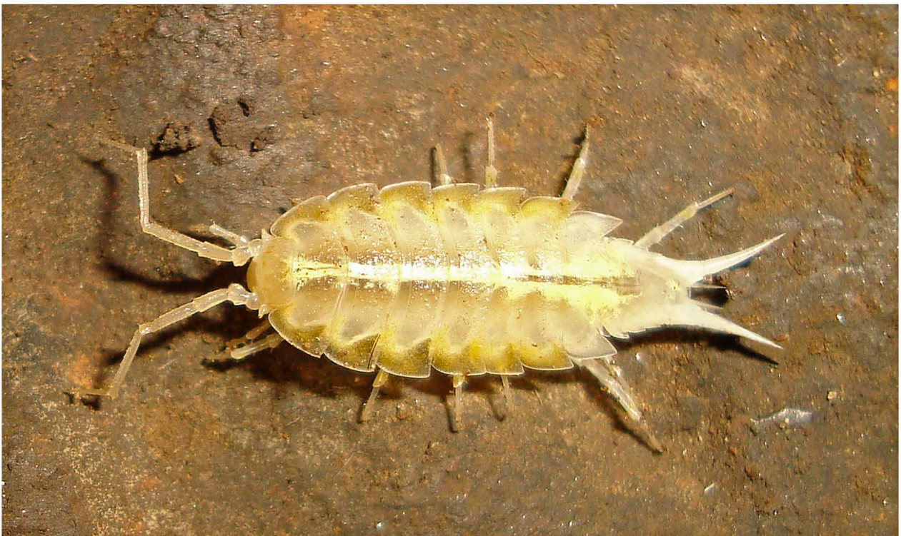
L'isopode Titanethes albus , osservato già dal Sillani nella cavità nel 1899