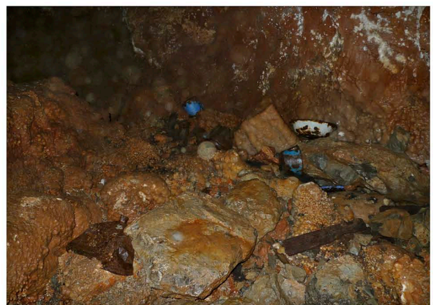
A sinistra: Gour sala terminale (punto 1)